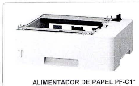
ALIMENTADOR DE PAPEL PF-C1*