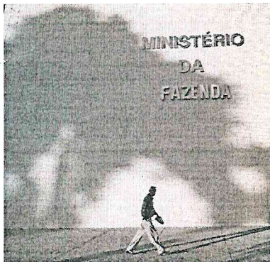
O programa concede descontos para pessoas físicas, micro e pequenas empresas, de 40% a 50% do valor total da dívida

Com a negociação, o governo projeta arrecadar