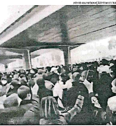
Fotos das manifestações foram retiradas da plataforma chinesa Weibo, que é semelhante ao Twitter

É importante destacar também que a China está prestes a realizar eleições para determinar uma nova equipe que lidere o Congresso Nacional do Povo. Além disso, o país asiático ainda está se recuperando de um surto de covid-19, que começou a ser enfrentado quando as rígidas medidas de restrição foram abruptamente retiradas pelo gover-