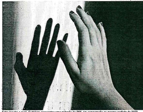
Entre janeiro e maio, Fortaleza apresentou uma redução de 25% em comparação ao mesmo período de 2022

Ao avaliar-se a acumulação dos primeiros cinco meses do ano, também é possível perceber uma melhora no cenário com relação aos Crimes Violentos Letais e Intencionais (CVLIs) contra mulheres tanto em Fortaleza, quanto no Ceará de maneira geral. Entre janeiro e maio, a capital apresentou