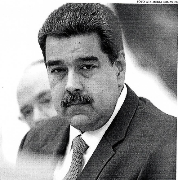
Em abril, Maduro promulgou uma lei reivindicando a posse do seu país sobre Essequibo

"A constante afirmação de que 'o Essequibo é nosso', juntamente com a criação de novos comandos militares e estruturas legais para supervisionar a defesa da região, está ajudando a institucionalizar um sentimento de perpétua posição pré-guerra", pontuou o Centro. O território em questão está envolvido em uma disputa antiga, mas que ganhou um novo capítulo no final do ano passado, quando o governo da Venezuela realizou um referendo que terminou com a maior parte da população votando pela anexação do espaço. Em dezembro de 2023, ambos os países concordaram em procurar uma via diplomática para solucionar o problema. No entanto, utilizando imagens de satélite e redes sociais, o CSIS detalhou que a base militar da Ilha Anacoco continuou sendo expandida. De acordo com os pesquisadores, uma ponte foi construída sobre o rio Cuyuni para conectar a margem venezuelana do rio à ilha. Além disso, o campo de aviação no local agora conta com uma pequena torre de controle, segundo o CSIS. As imagens de satélite revelaram ainda uma área próxima ao campo de aviação com tendas suficientes "para uma unidade do tamanho de um batalhão com várias centenas de agentes".