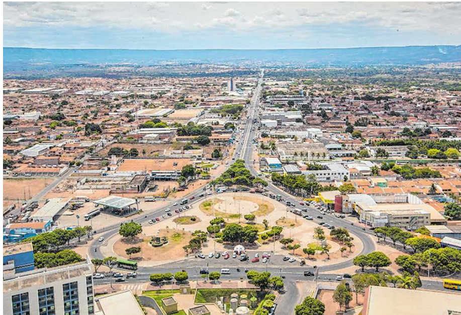
JUAZEIRO do Norte será o município-polo do projeto no Ceará