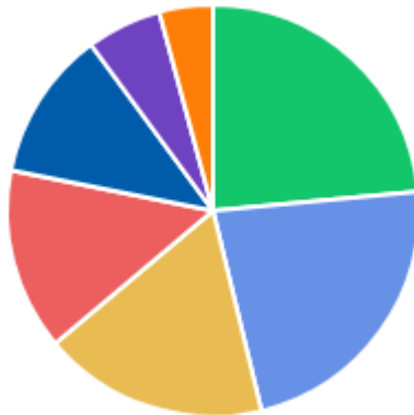
DFDs POR ÁREA DEMANDANTE