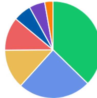
VALOR POR ÁREA DEMANDANTE